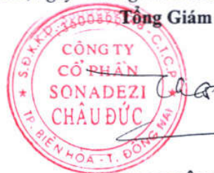
PHẠM XUÂN BÁCH