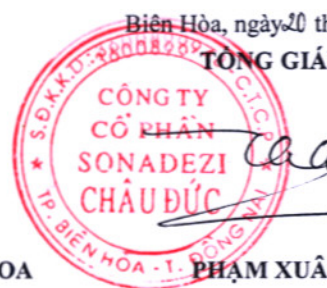
PHẠM XUÂN BÁCH